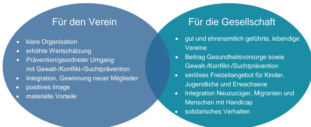
Abbildung 1: Nutzen von Sport-verein-t