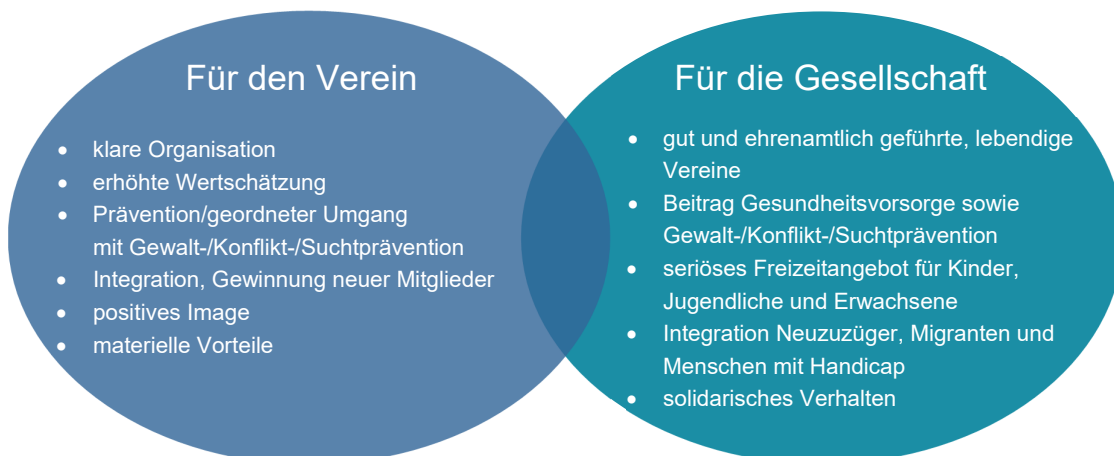
Abbildung 1: Nutzen von Sport-verein-t