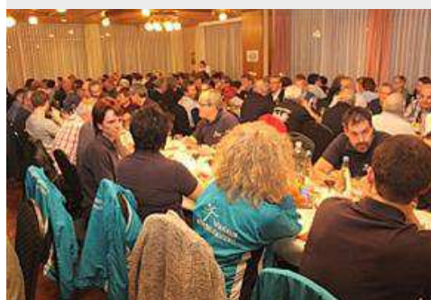
Hundertdreissig Mitglieder nahmen an der HV teil.